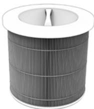
1 x filtr HEPA