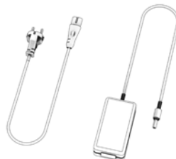
1 x Kabel